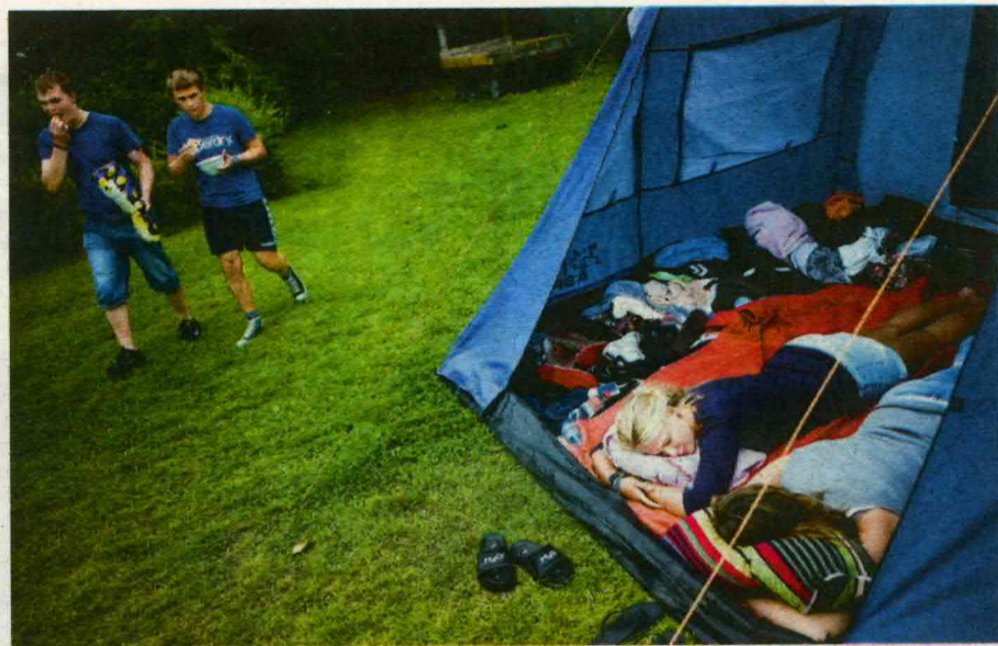
DET TÆRER PA KRÆFTERNE at være på bibelcamping. Selv om der ikke bliver drukket alkohol, fester deltagerne på ungcampen hele natten. De sene timer bliver blandt andet brugt på religiøse sange og samtaler – med hinanden og med Gud.!