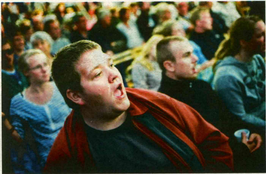
UNDER FÆLLESGUDSTJENESTEN , hvor både voksne, børn og deltagerne fra ungcampen er med, synger de mere end 200 deltagere med på salmerne. Og de gør det med en kraft og indlevelse, der næsten får taget på det kæmpemæssige telt til at lette.!