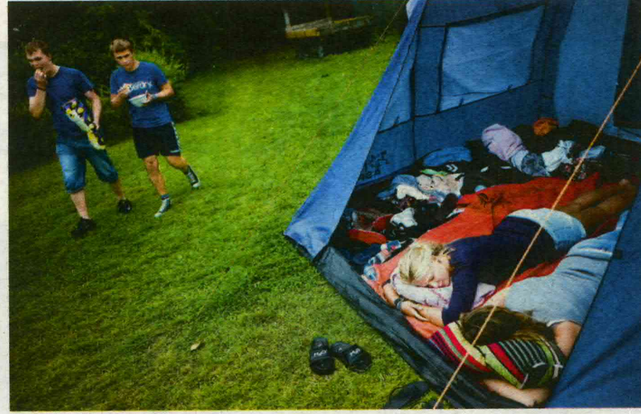
DET TÆRER PÅ KRÆFTERNE at være på bibelcamping. Selv om der ikke bliver drukket alkohol, fester deltagerne på ungcampen hele natten. De sene timer bliver blandt andet brugt på religiøse sange og samtaler – med hinanden og med Gud!