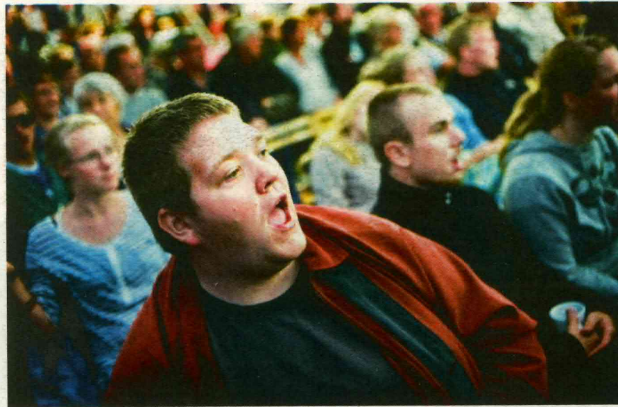
UNDER FÆLLESGUDSTJENESTEN , hvor både voksne, børn og deltagerne fra ungcampen er med, synger de mere end 200 deltagere med på salmerne. Og de gør det med en kraft og indlevelse, der næsten får taget på det kæmpemæssige telt til at lette!